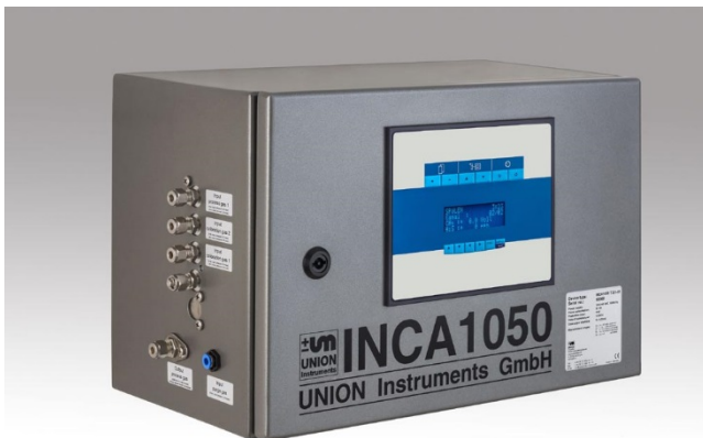
Bild 2 : Die Gasanalysatoren INCA eignen sich besonders auch zur Bestimmung stark schwankender Konzentrationen von H 2 S, z.B. in Faulgasen