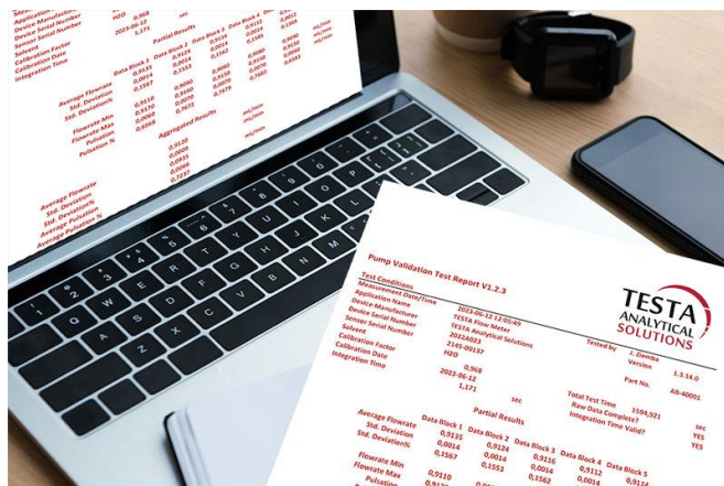
Bildunterschrift: Ein Qualifizierungsbericht in nur 10 Minuten