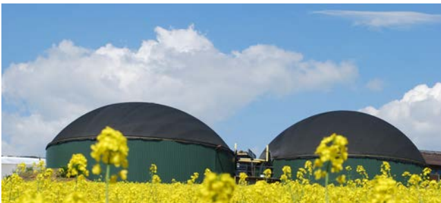
Bild 1: Typische Biogasanlage